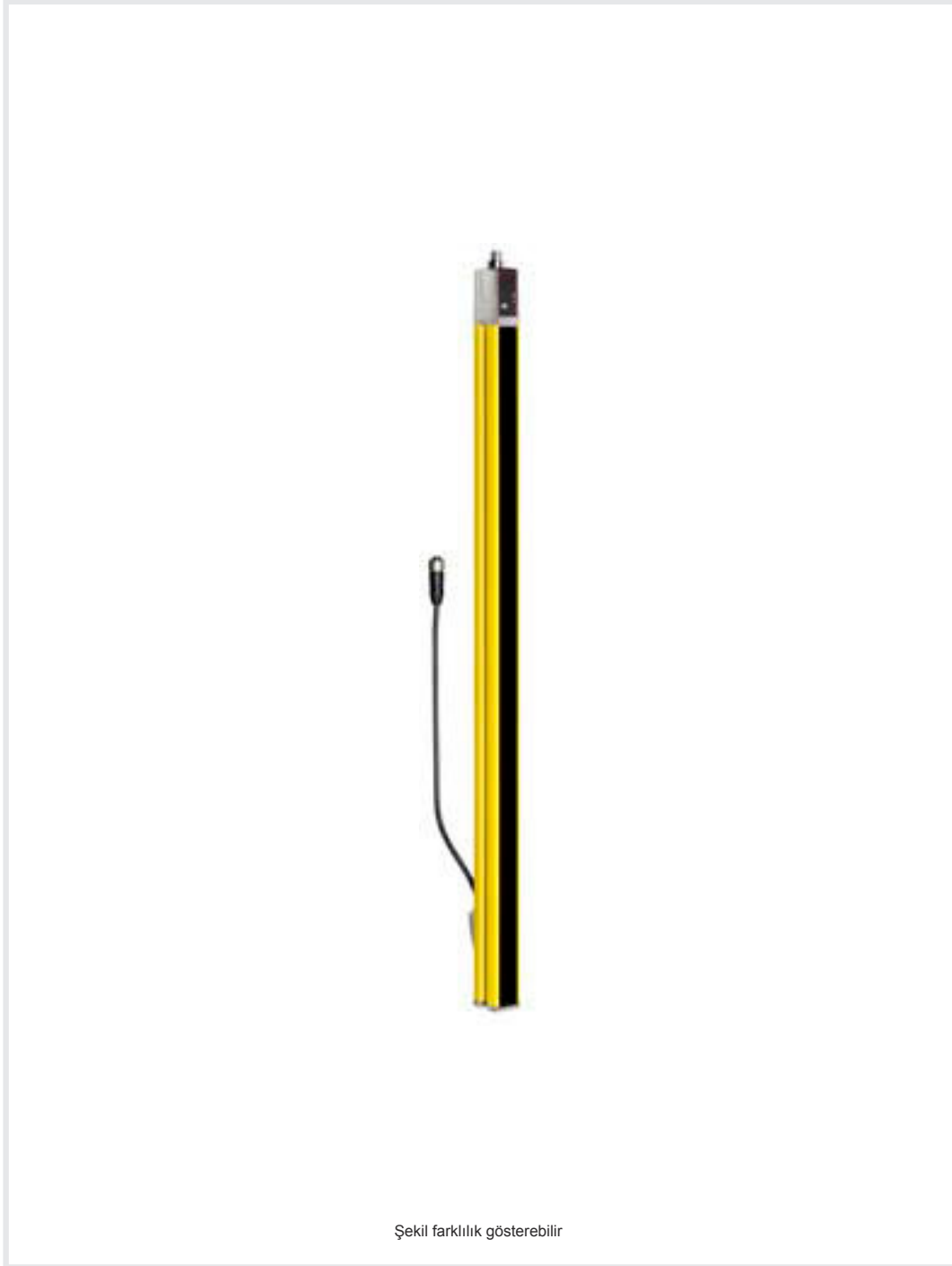
Şekil farklılık gösterebilir