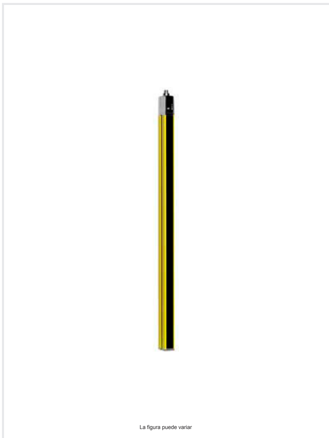
La figura puede variar