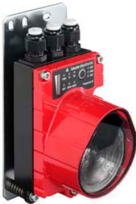
Figure pouvant varier