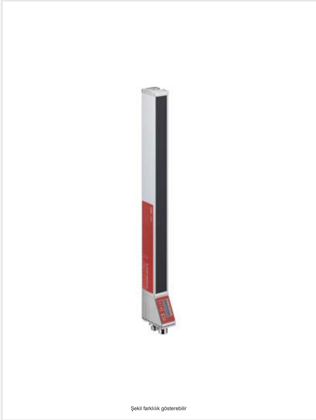
Şekil farklılık gösterebilir