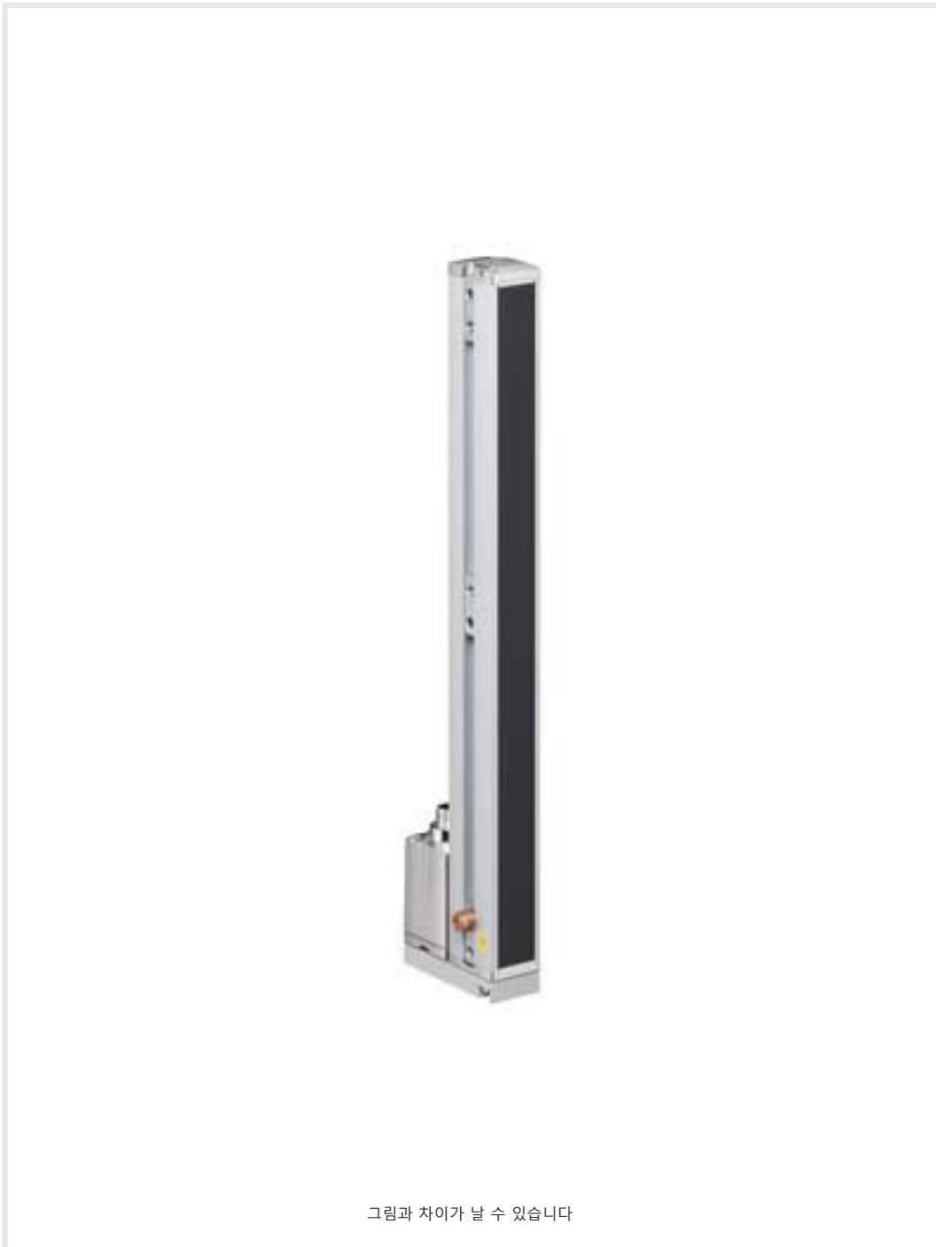
그림과 차이가 날 수 있습니다