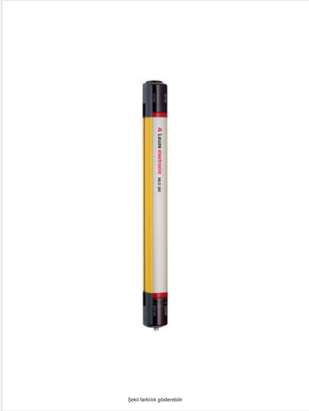
Şekil farklılık gösterebilir