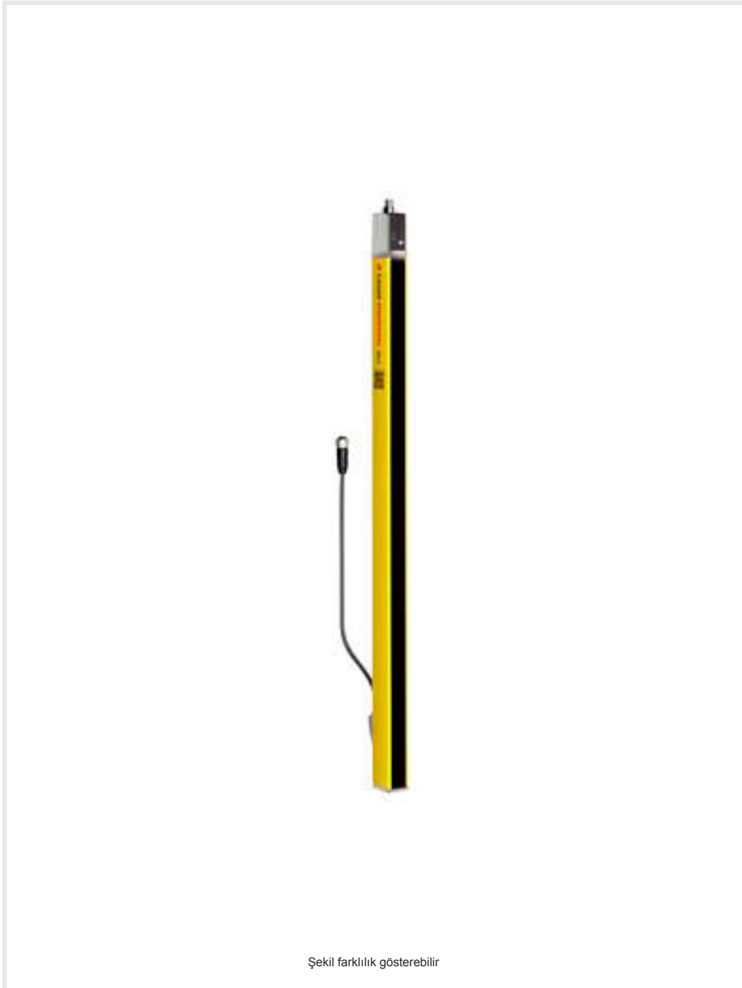
Şekil farklılık gösterebilir