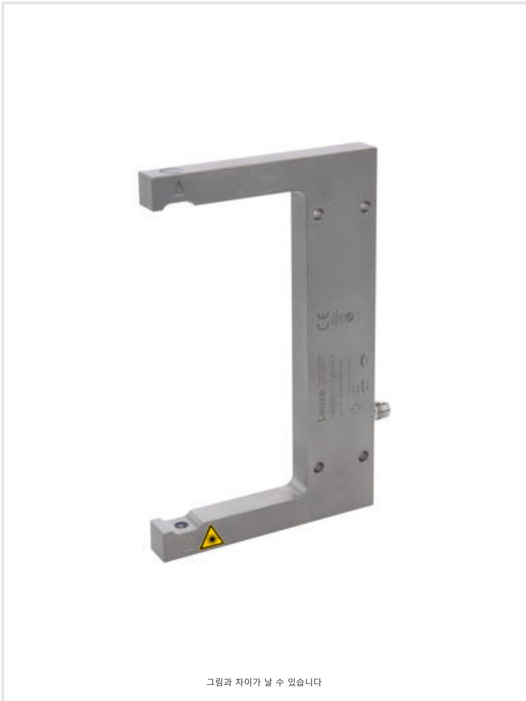
그림과 차이가 날 수 있습니다