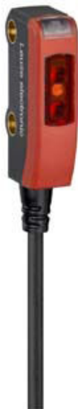
Figure pouvant varier