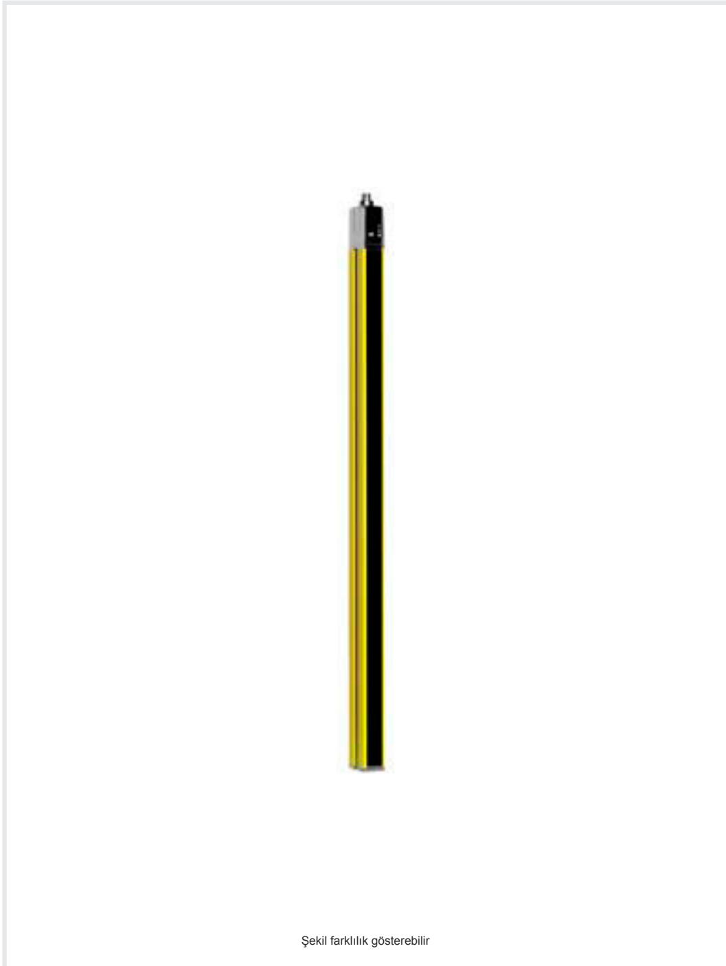
Şekil farklılık gösterebilir