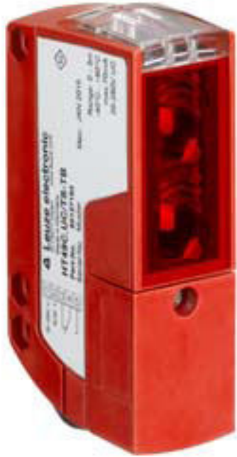
Şekil farklılık gösterebilir