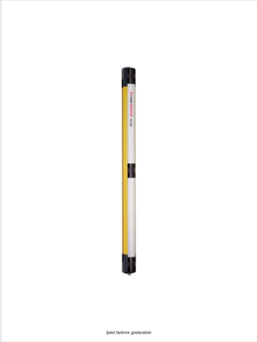
Şekil farklılık gösterebilir