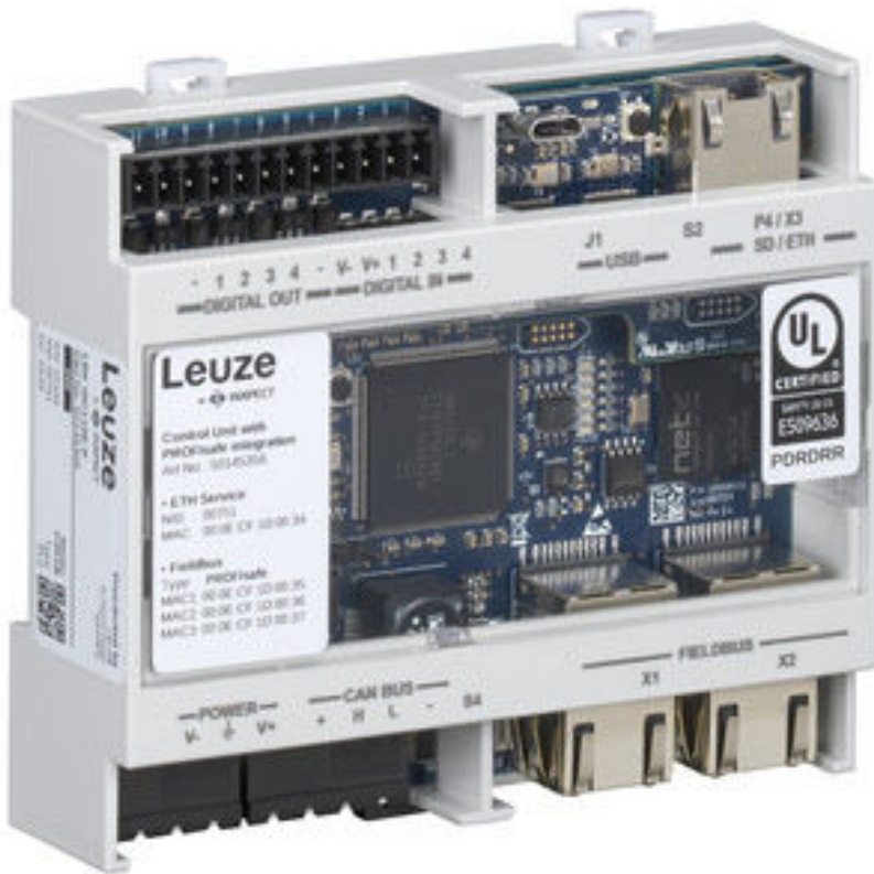
그림과 차이가 날 수 있습니다