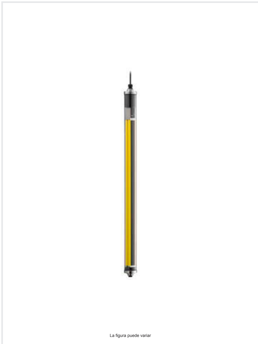
La figura puede variar